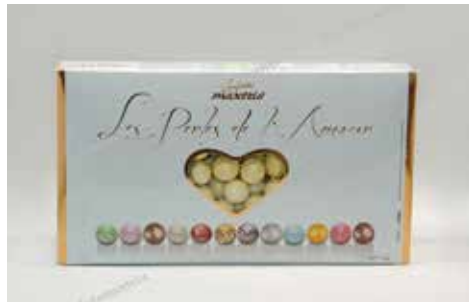
23 ΠΕΡΛΑ ΦΟΥΝΤΟΥΚΙ