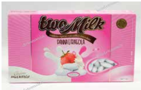
1 ΦΡΑΟΥΛΑ ΣΑΝΤΙΓΥ