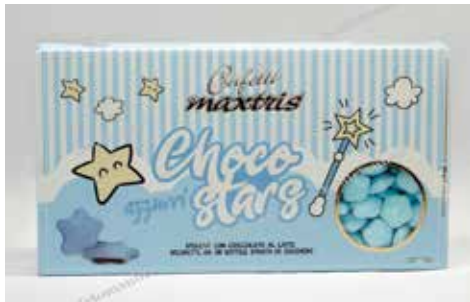
34 ΑΣΤΕΡΙ ΣΟΚΟΛΑΤΑ