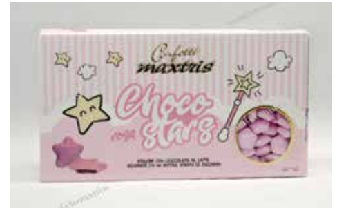
33 ΑΣΤΕΡΙ ΣΟΚΟΛΑΤΑ