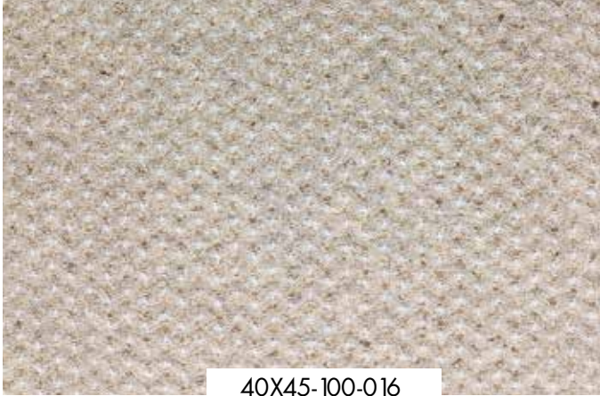
ΜΑΝΤΗΛΙΑ ΦΙΔΑΚΙ Λευκό, εκρού