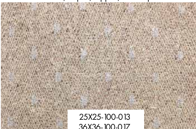
ΜΑΝΤΗΛΙΑ ΠΟΥΑ Λευκό, εκρού, άμμου, σάπιο μήλο

25X25-100-013 36X36-100-017 40X45-100-022 50X60-100-027