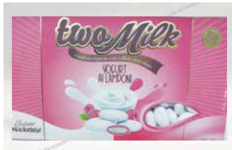
2 ΦΡΟΥΤΑ ΔΑΣΟΥΣ