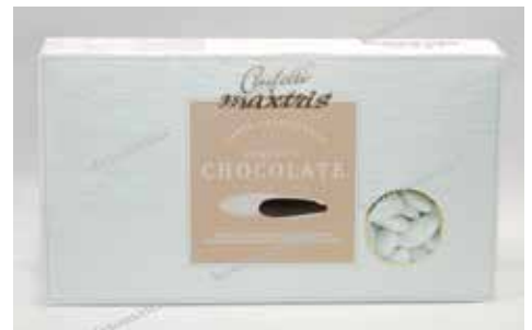
9 ΣΟΚΟΛΑΤΑ ΥΓΕΙΑΣ