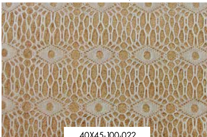
ΔΙΧΤΥ Λευκό, Ιβουάρ

25X25-100-013 36X36-100-017 40X45-100-022 50X60-100-027