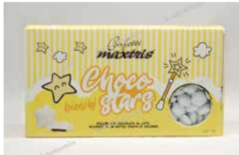
35 ΑΣΤΕΡΙ ΣΟΚΟΛΑΤΑ