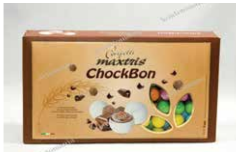
26 ΚΡΕΙ ΔΗΜΗΤΡΙΑΚΩΝ