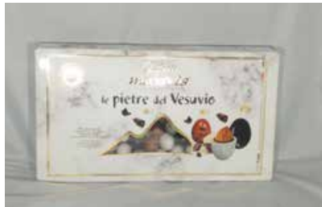
20 ΑΜΥΓΔΑΛΟ ΒΟΣΣΑΛΟ