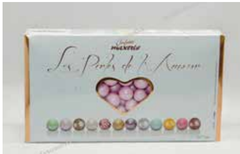
22 ΠΕΡΛΑ ΦΟΥΝΤΟΥΚΙ