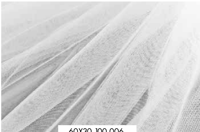
ΤΟΥΛΙ ΓΙΑ ΓΕΜΙΣΜΑ

Στα πουγκιά και στα υλικά δεν συμπεριλαμβάνεται ΦΠΑ24%