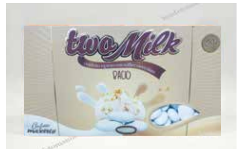
6 ΠΑΡΦΕ ΦΟΥΝΤΟΥΚΙ