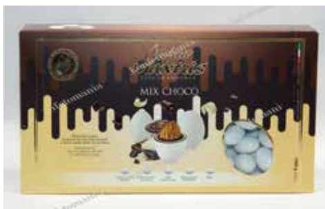
10 ΣΟΚΟΛΑΤΑ ΑΜΥΓΔΑΛΟ 5 ΓΕΥΣΕΙΣ