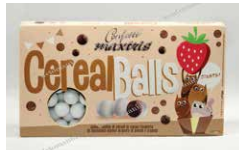
27 ΚΡΕΙ ΣΟΚΟΛΑΤΑ ΦΡΑΟΥΛΑ