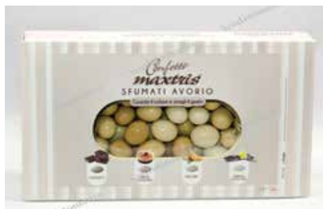
11 ΣΟΚΟΛΑΤΑ ΑΜΥΓΔΑΛΟ 4 ΓΕΥΣΕΙΣ