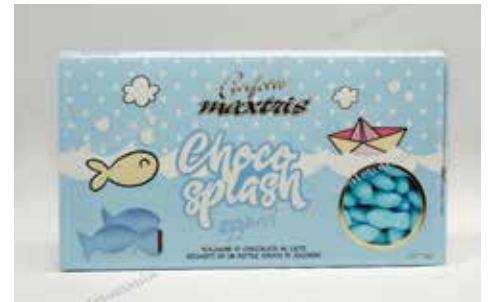
36 ΨΑΡΑΚΙ ΣΟΚΟΛΑΤΑ