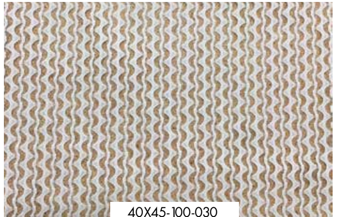
ΜΑΝΤΗΛΙΑ ΖΙΚ ΖΑΚ Λευκό, εκρού