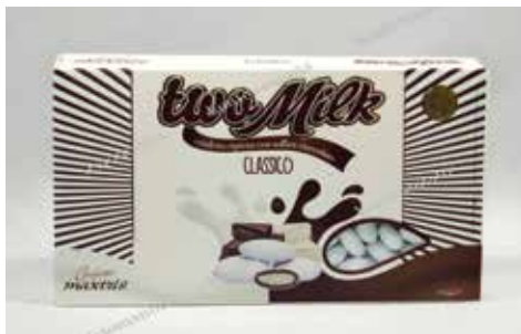
4 ΣΟΚΟΛΑΤΑ ΓΑΛΑΚΤΟΣ