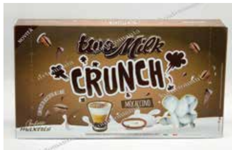
8 ΣΟΚΟΛΑΤΑ ΚΑΦΕΣ