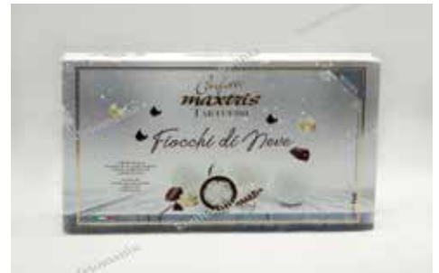
24 ΤΡΟΥΦΑ ΚΑΡΥΔΑ