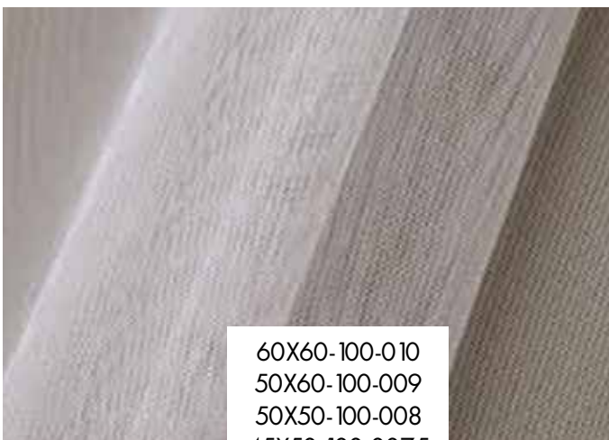
ΜΑΝΤΗΛΙΑ ΟΡΓΑΝΤΖΑ Λευκό/ Ιβουάρ

60X60-100-010 50X60-100-009 50X50-100-008 45X50-100-0075 35X35-100-006