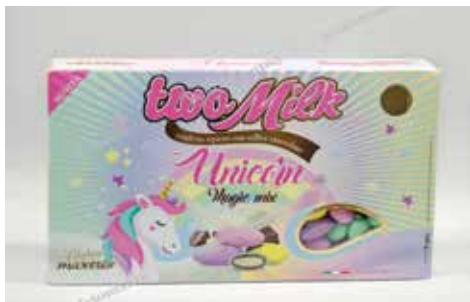
25 ΣΟΚΟΛΑΤΑ ΜΟΝΟΚΕΡΩΣ