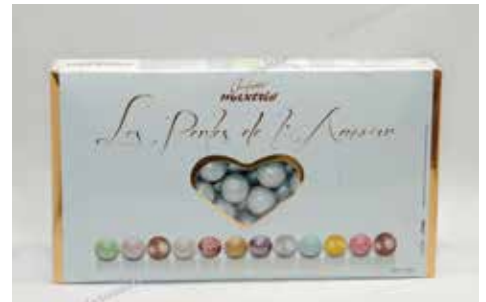
21 ΠΕΡΛΑ ΦΟΥΝΤΟΥΚΙ