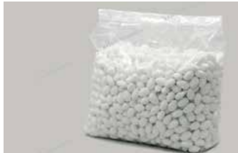
17 ΑΜΥΓΔΑΛΟ ΚΑΒΟΥΡΝΤΙΣΜΕΝΟ