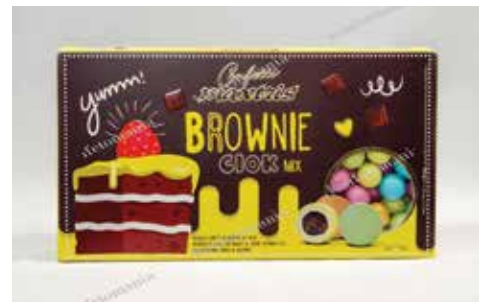
30 ΚΕΪΚ ΣΟΚΟΛΑΤΑ