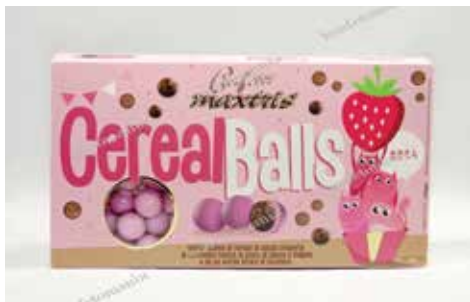
28 ΚΡΕΙ ΣΟΚΟΛΑΤΑ ΦΡΑΟΥΛΑ