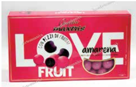
19 ΚΕΡΑΣΙ ΣΟΚΟΛΑΤΑ