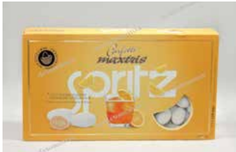
16 ΠΟΡΤΟΚΑΛΙ ΑΜΥΓΔΑΛΟ