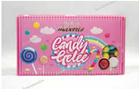
31 ΖΕΛΕ ΣΟΚΟΛΑΤΑ