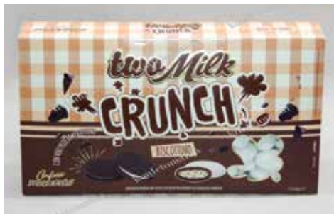
7 ΜΠΙΣΚΟΤΟ ΣΟΚΟΛΑΤΑ