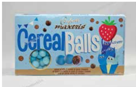
29 ΚΡΕΙ ΣΟΚΟΛΑΤΑ ΦΡΑΟΥΛΑ