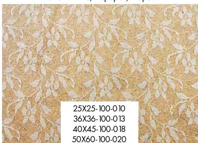
ΦΥΛΛΑΡΑΚΙ (ΛΕΖΑ) Λευκό, Ιβουάρ, της Άμμου, Ροζ, Σάπιο Μήλο, Βεραμάν, Σομόν

25X25-100-010 36X36-100-013 40X45-100-018 50X60-100-020 40X45-100-022